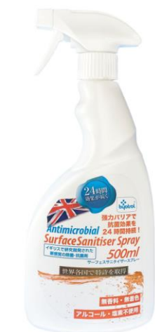
サーフェス サンタイザー スプレータイプ 500ml