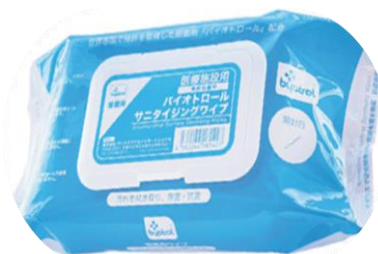
サニタイジングワイブ